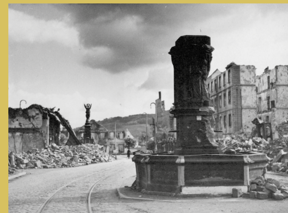
→ Aspect d'un quartier de la ville après les combats.