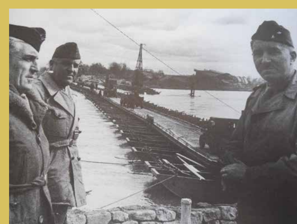
→ Le général Dromart (à droite) commandant le Génie de la Première Armée devant le pont de Spire.