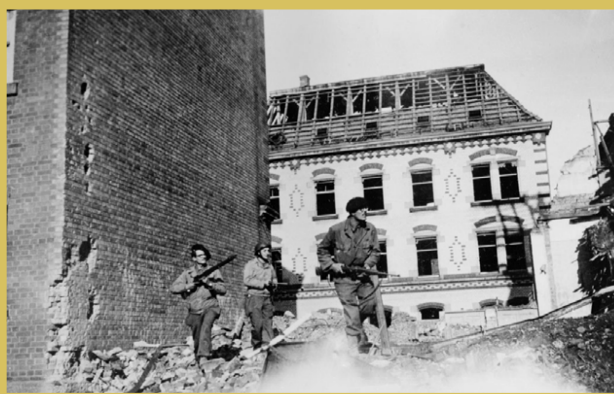
→ Des combattants du Corps Franc Pommiers, devenu le 49 ème RI, entrent dans Stuttgart.