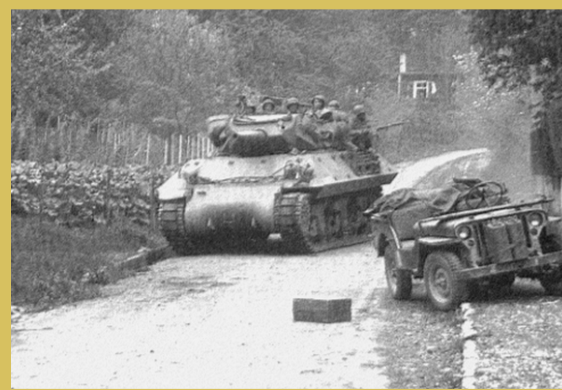
→ Embuscade à l'entrée de Stuttgart : des tireurs isolés viennent de faire feu sur une jeep et un tank destroyer.