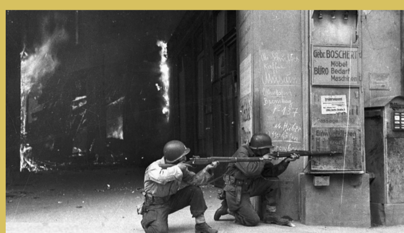
→ Combat de rue dans Karlsruhe.