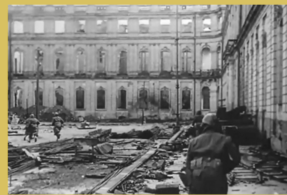
→ Patrouille dans Stuttgart après la prise de la ville.