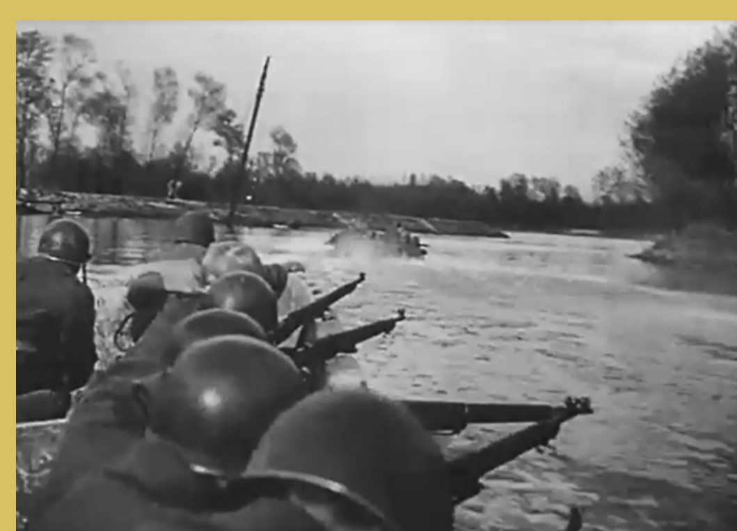
→ A l'aube du 31 mars, franchissement du Rhin à bord de stormboats manœuvrés par des motoristes du Génie.

Le 31 mars , franchissement du Rhin : la 3 ème DIA et le 2 ème DIM établissent 2 têtes de pont sur le Rhin dans la région de Spire. Le 2 avril , l'ensemble du 2 ème CA passe le Rhin sur les ponts de Spire et de Gernersheim.