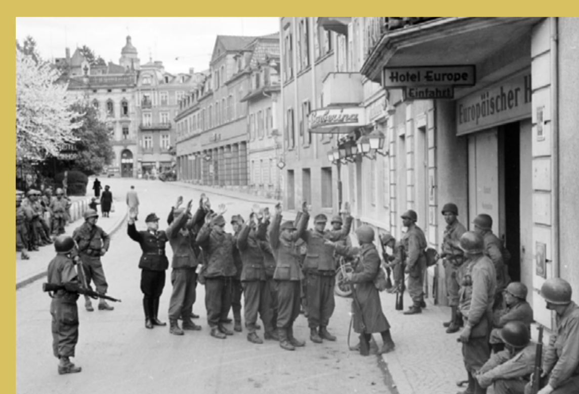
→ Reddition des défenseurs de Baden-Baden aux troupes françaises.