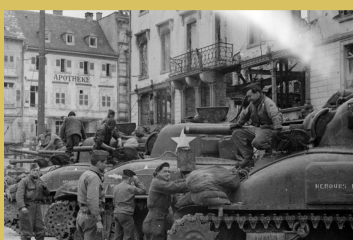
→ Chars de la 5 ème DB sur la place du marché après la prise de la ville, le 4 avril.