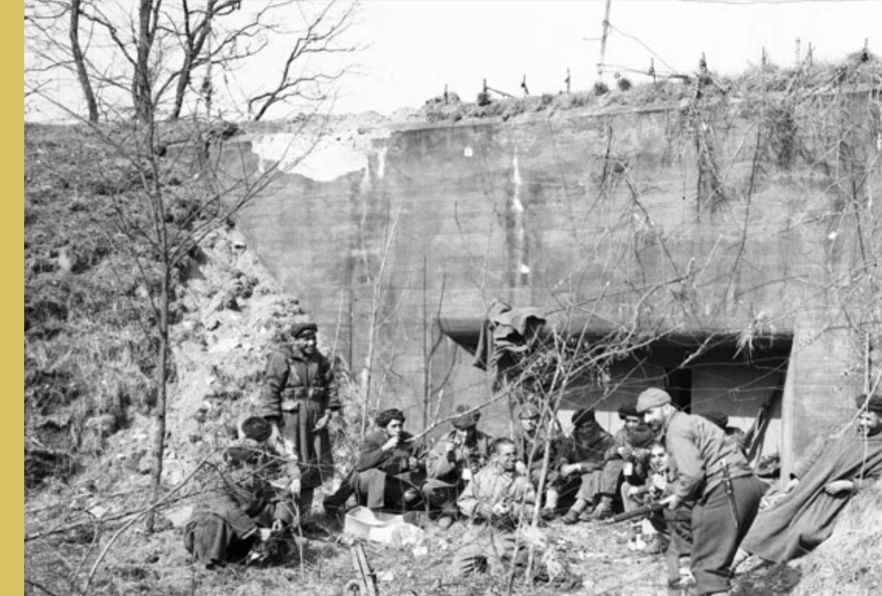
→ Un instant de repos pour une section du 4 ème GTM devant un bunker de la ligne Siegfried.