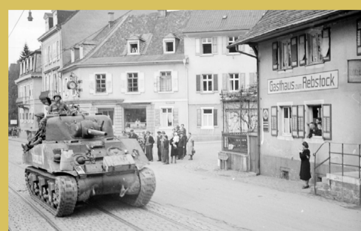
→ Entrée dans Baden Baden d'un Sherman M 4 du 4 ème escadron du 5 ème RCA.