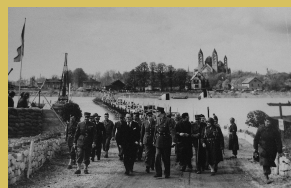
→ Le 7 avril, le général de Gaulle, accompagné de M. Diethelm, et du général de Lattre, traverse le Rhin à Spire sur le pont français de bateaux.