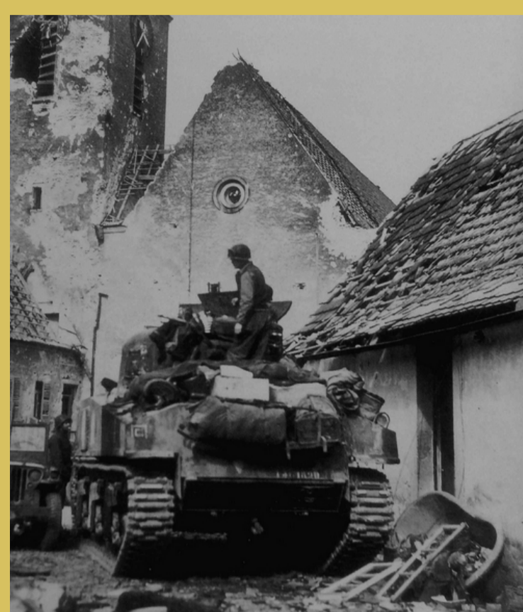
→ Entrée de la 5 ème DB dans Scheibhardt, premier village conquis.