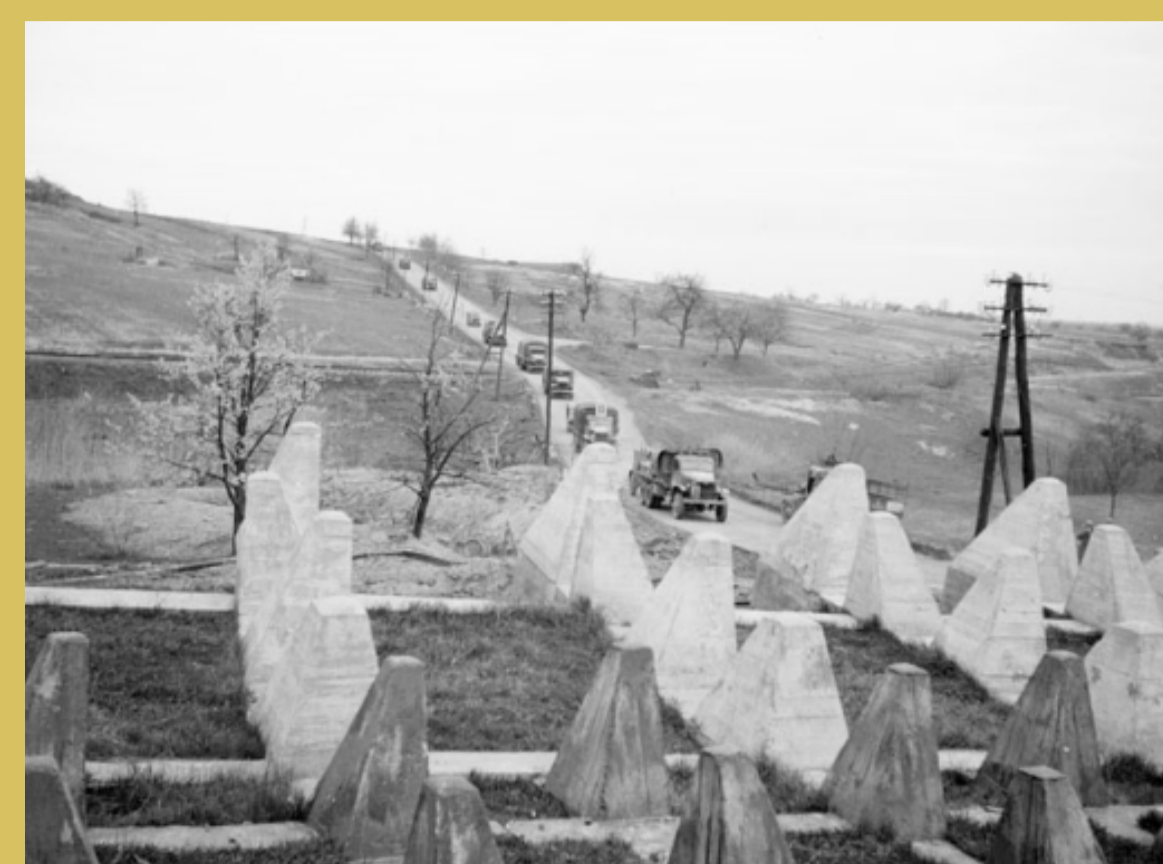
→ Un convoi de GMC passe devant des Dents de Dragons de la Ligne Siegfried qui vient d'être prise par les troupes françaises.