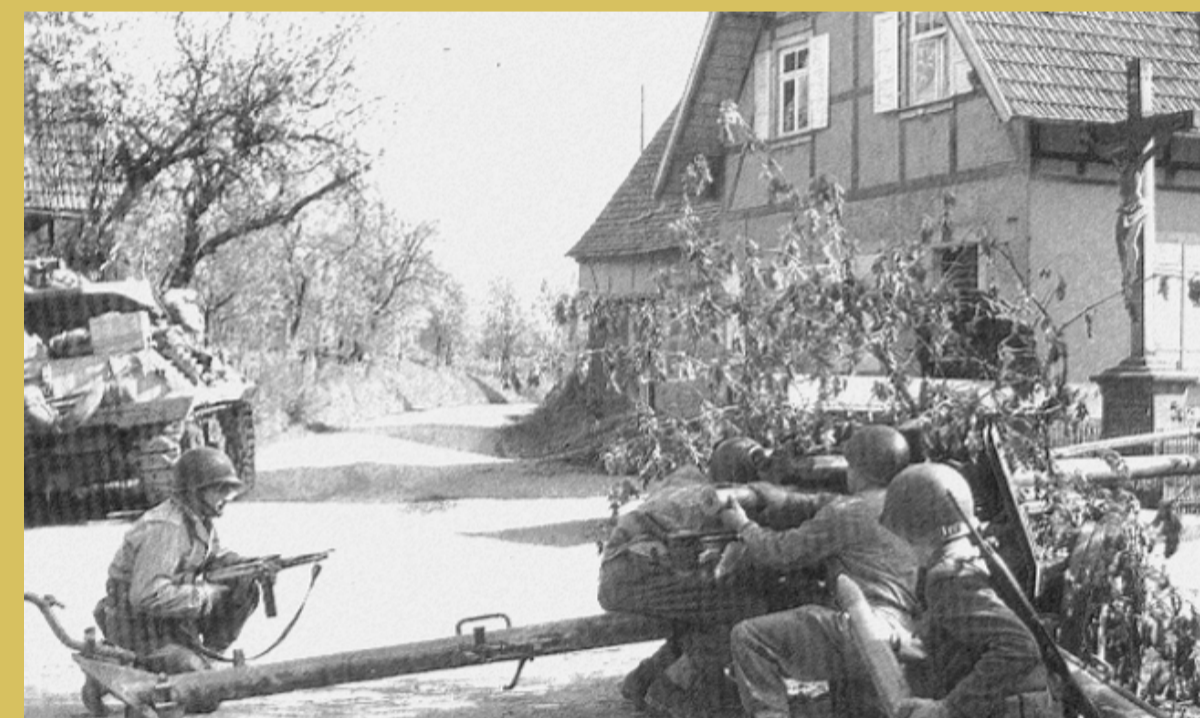
→ Canon PAK 70 pris aux Allemands et retourné contre eux.