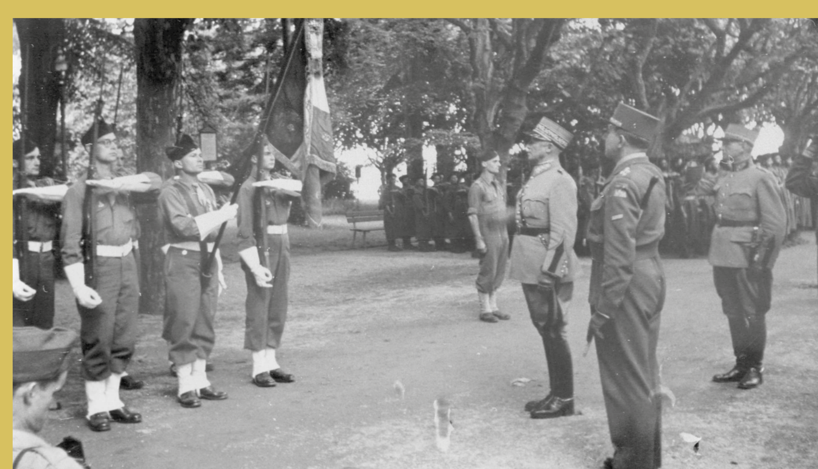
→ Le général suisse Guisan salue le drapeau du 6 ème RIC.

Prises d'armes et défilés militaires se succèdent à Constance et dans autres villes. De Lattre veut honorer ses visiteurs mais aussi agir sur la jeunesse allemande et lui démontrer que la puissance de l'Armée française est une réalité non contestable.