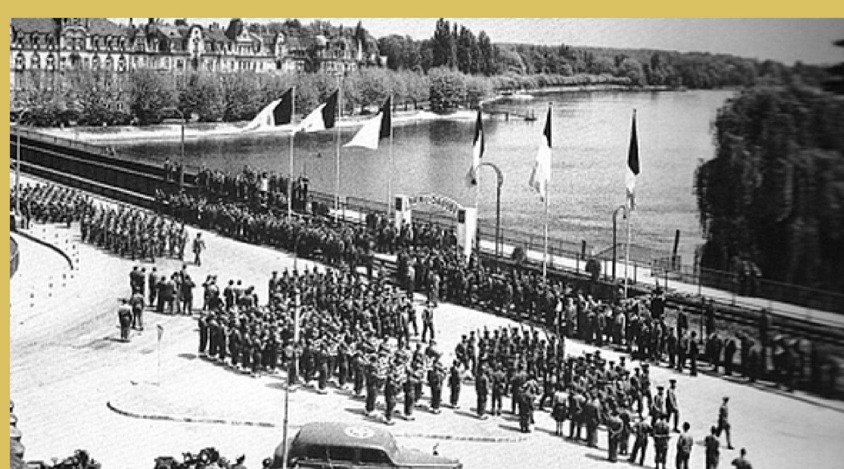
→ Le 152 ème RI défile à Constance.

Prises d'armes et défilés militaires se succèdent à Constance et dans autres villes. De Lattre veut honorer ses visiteurs mais aussi agir sur la jeunesse allemande et lui démontrer que la puissance de l'Armée française est une réalité non contestable.