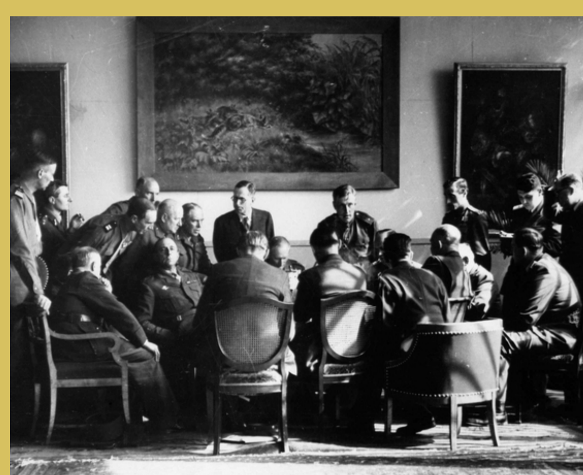
→ Réunion de la conférence interalliée au QG des forces soviétiques.

Le général de Lattre participe à la commission interalliée sur la délimitation des zones d'occupation de l'Allemagne et des quatre secteurs de Berlin puis visite Berlin.