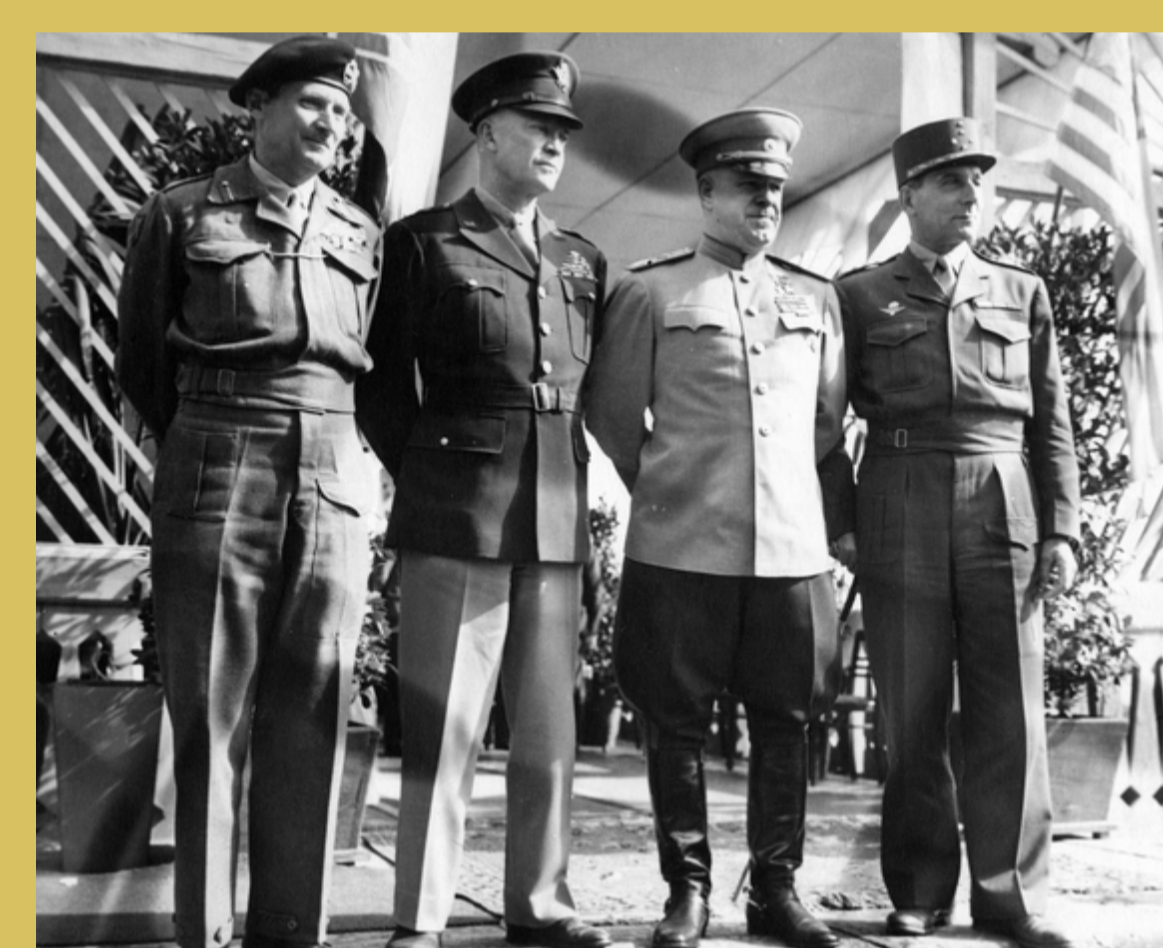
→ Le maréchal Montgomery, le général Eisenhower, le maréchal Joukov et le général de Lattre.