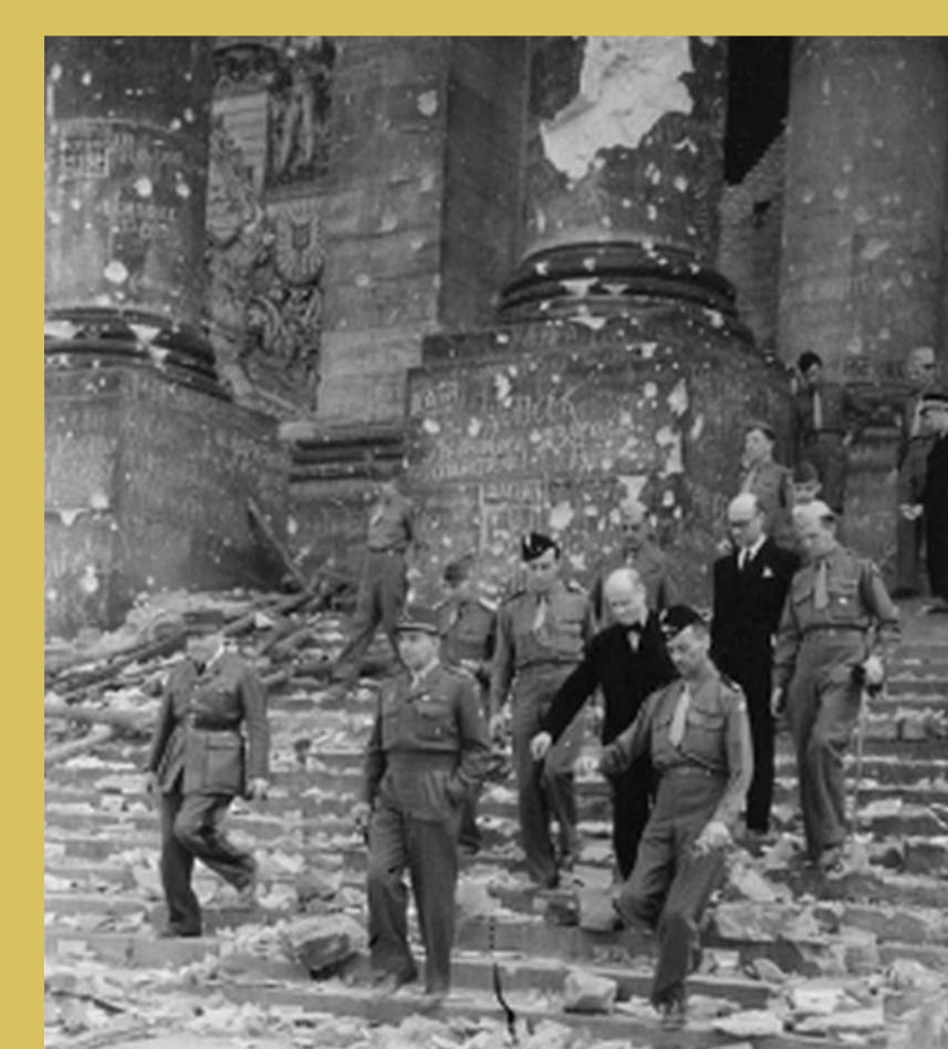
→ Devant le Reichstag.