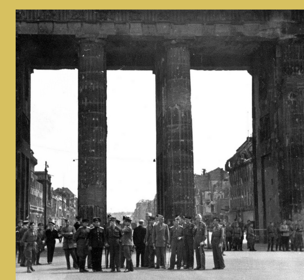
→ Le maréchal Joukov et le général de Lattre, accompagnés de leurs conseillers, devant la Porte de Brandebourg.