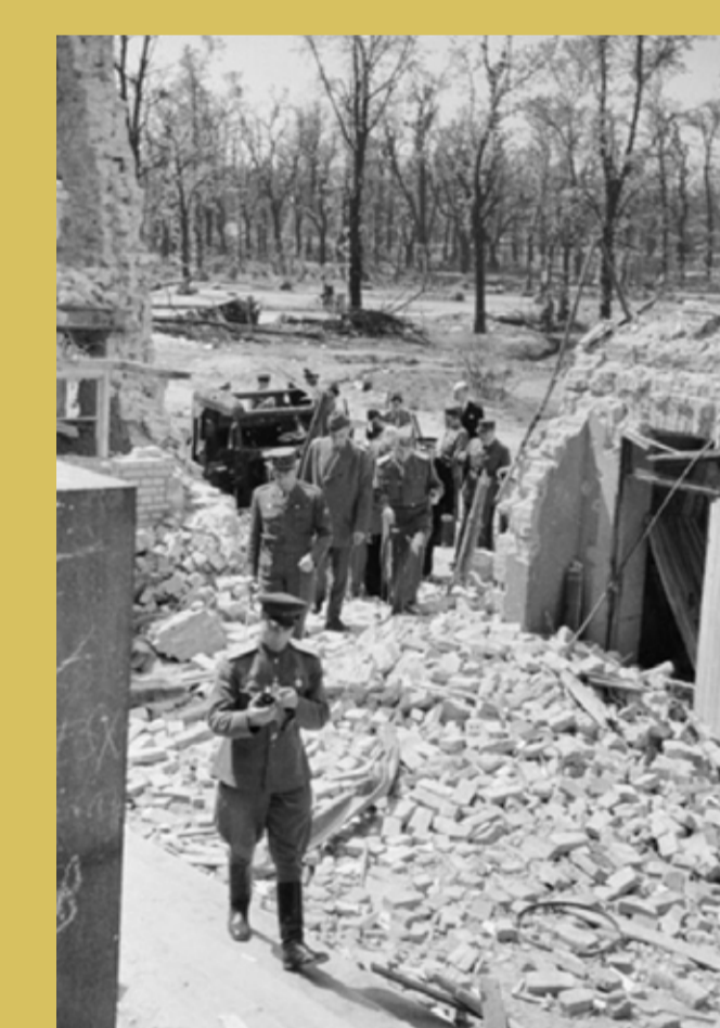
→ Dans les ruines du bunker d'Hitler à la chancellerie.