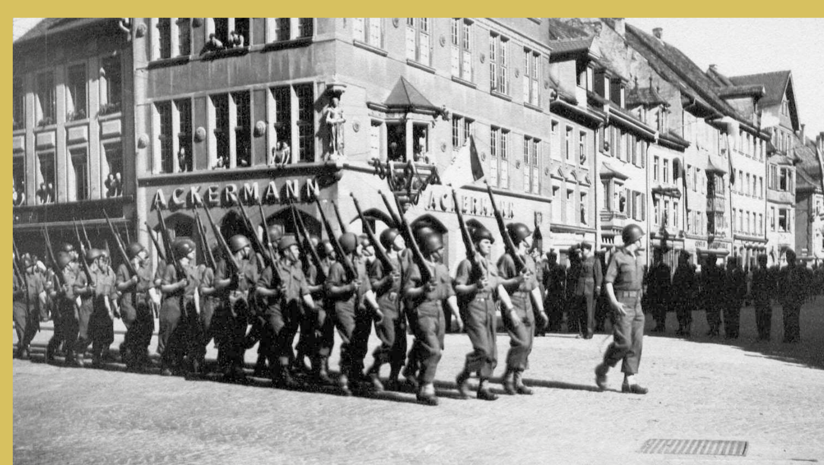
→ Défilé du 11/23 ème RIC à Villingen.