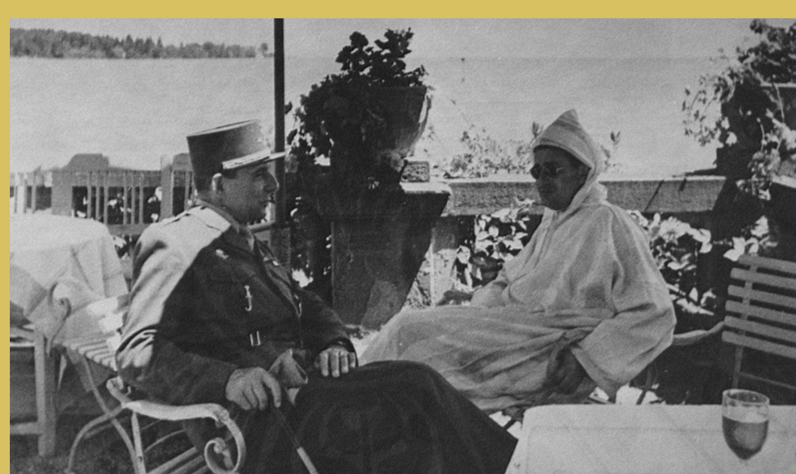
→ Le général de Lattre et le sultan du Maroc.