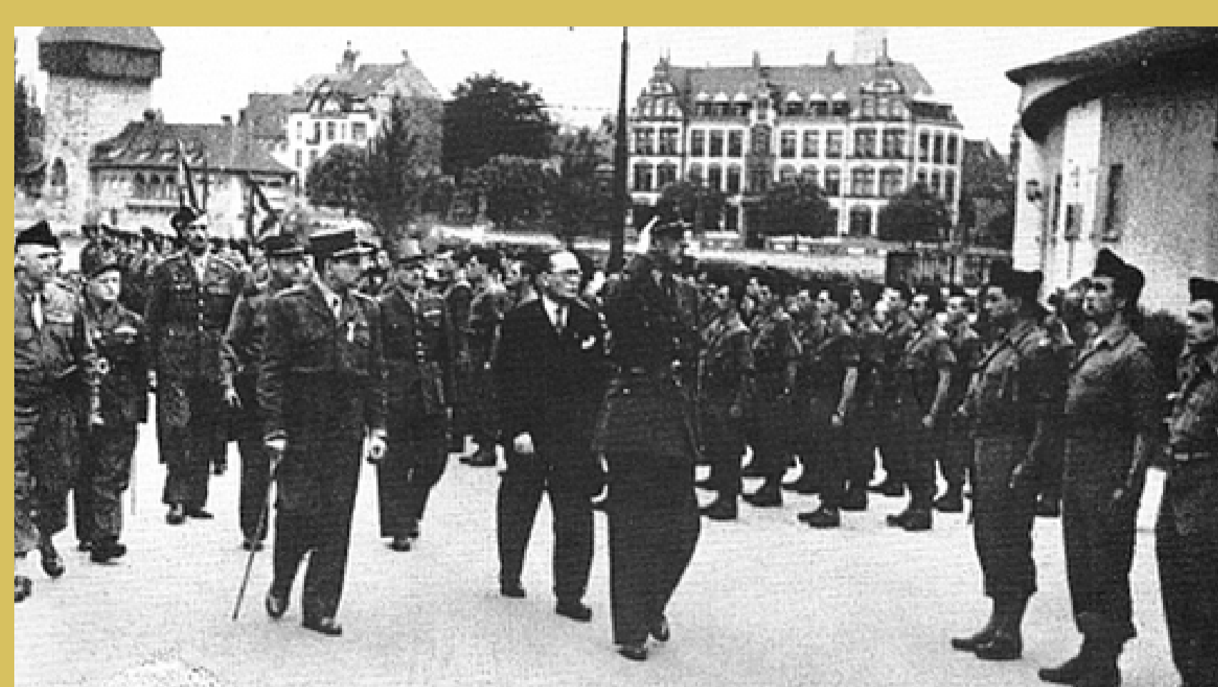
→ Le général de Gaulle passe en revue des unités de la Première Armée.

Le général de Lattre s'installe à Lindau puis à Constance. Il y reçoit le général de Gaulle et de nombreuses personnalités françaises et étrangères venues voir la Première Armée.