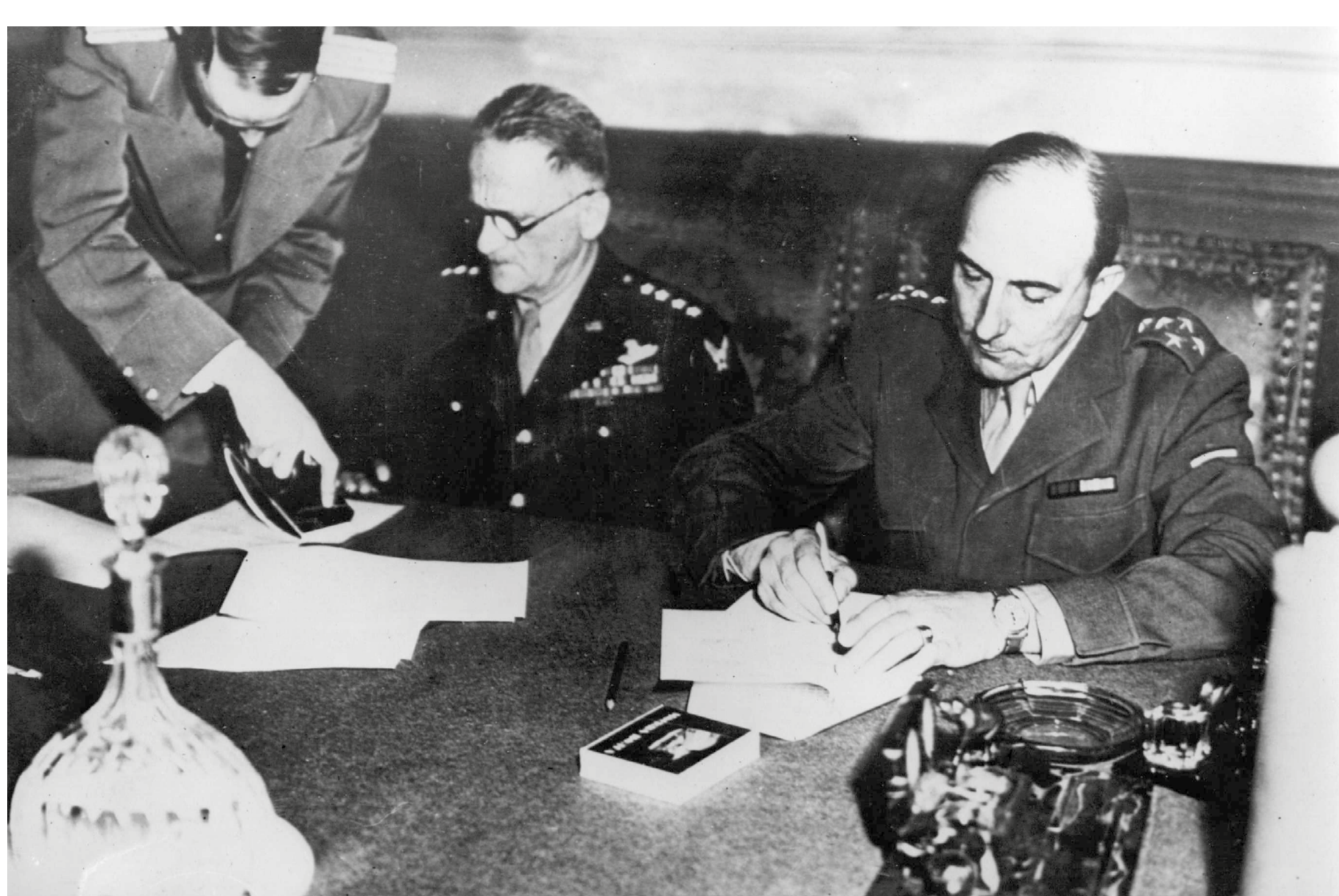
→ Le général de Lattre signe l'acte de capitulation de l'Allemagne nazie.