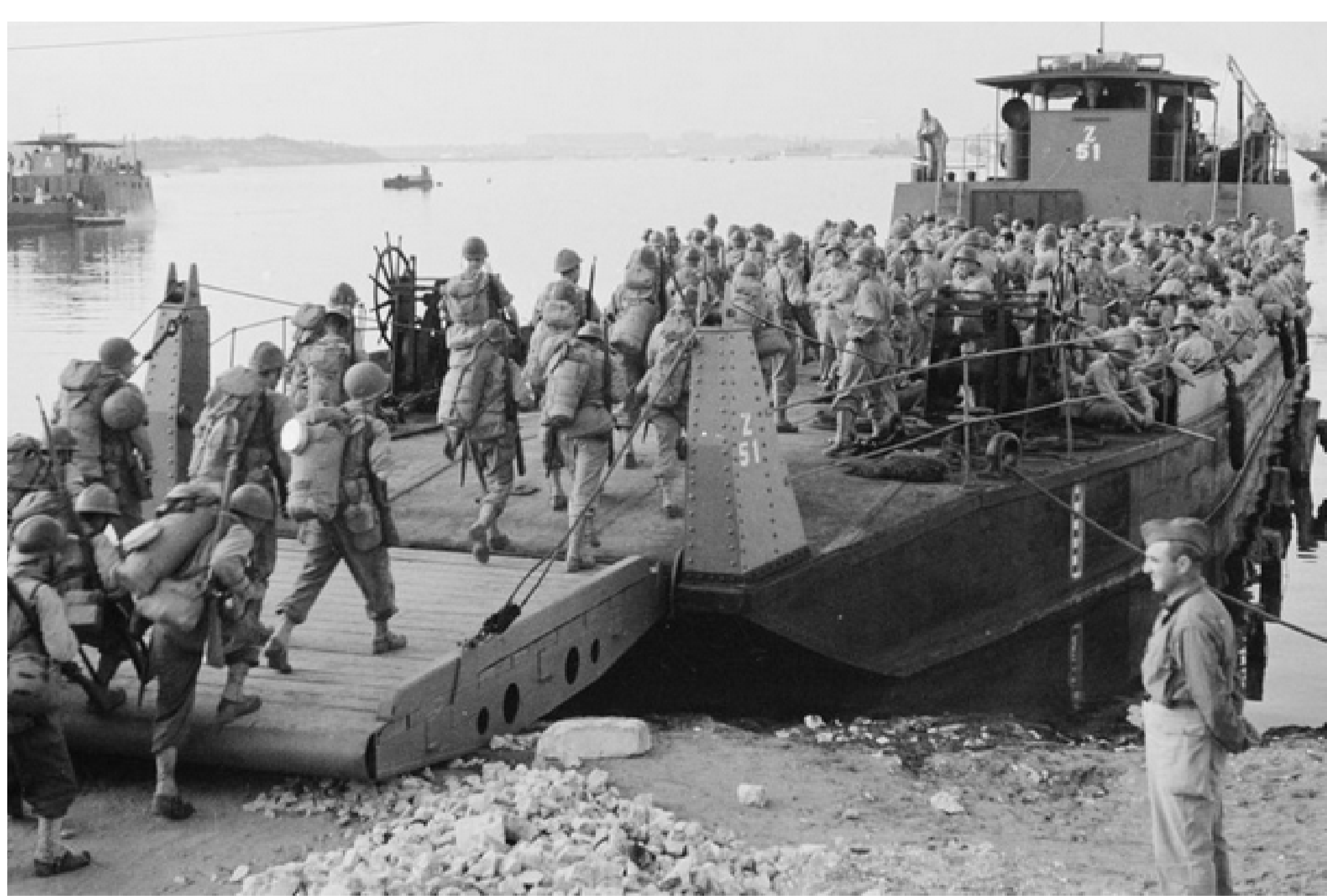
→ Embarquement des troupes françaises pour les côtes de Provence.