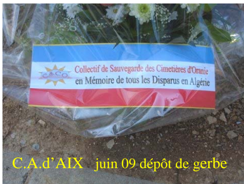
C.A.d'AIX juin 09 dépôt de gerbe