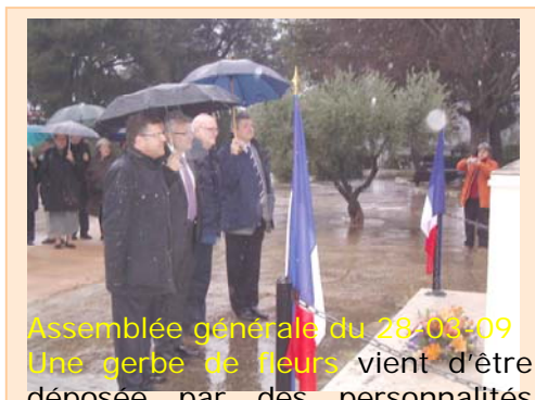
Assemblée générale du 28-03-09 Une gerbe de fleurs vient d'être déposée par des personnalités devant le Monument aux Morts de Santa Cruz à Nîmes.

A la veille de l'exode estival où nombreux sont celles et ceux qui s'apprêtent à décrocher quelques jours de la tourmente routinière où la plupart se laissent enliser, sachez qu'au CSCO il n'y aura pas de relâche et qu'avec le précieux concours de l'ensemble des amis Administrateurs qui m'entourent depuis bientôt cinq ans pour la majorité, un peu moins pour quelques autres mais tous aussi motivés, disponibles et déterminés à poursuivre cette lourde et noble tâche que nous nous sommes les uns et les autres volontairement assignés dans le seul souci du DEVOIR de MEMOIRE que nous n'avons nullement le droit d'oublier ou délaisser.