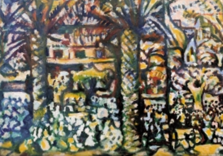
Sauveur Galliéro, Le 14 Juillet