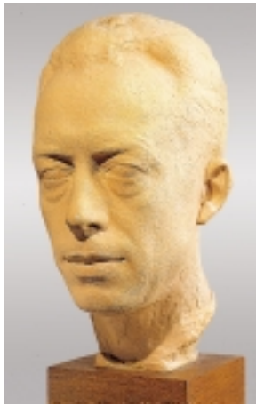
Marcel Damboise, Buste de Camus

situent à Alger autour de lieux privilégiés, à Tipasa, à la Villa Abdel-Tif, à Paris dans le monde du théâtre, enfin dans la quiétude de Lourmarin.